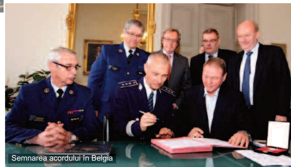
Semnarea acordului în Belgia

Cu fiecare rezultat de excepție, obținut de profesorii și elevii clujeni, ne întrebăm care să fie „secretul” menținerii constante în zona excelenței. Am descoperit, însă, răspunsul printre rânduri, într-o singură cheie, aceea a iubirii necondiționate față de profesie, a devotamentului în slujirea comunității, idei ce au generat amplul proces al devenirii identitare, construit cu mintea și, deopotrivă, cu sufletul după chipul și asemănarea Europei, pe care am descoperit-o cu drag, în urmă cu ani, în inima Clujului.