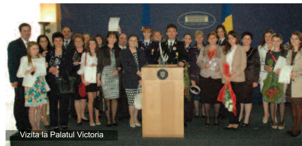
Vizita la Palatul Victoria

În cadrul celei de-a XI-a ediții a competiției pentru obținerea certificatului Școală Europeană, la care s-au înscris 117 unități de învățământ din 35