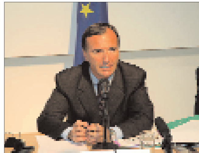
Comisarul european Franco Frattini într-o nouă vizită în țara noastră