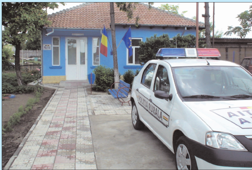
Pagină realizată de Roxana GHEORGHIU PAP

curând, urmează și la acest post să funcționeze Intranetul și Internetul, tocmai pentru a elimina timpii morți. Din păcate, recent, atmosfera patriarhală a comunei a fost perturbată. Au avut loc două accidente de circulație, cauza fiind traversările neregulate: a fost rănită o bătrână de 82 de ani, sub influența alcoolului, și un elev care a traversat prin fața unui autobuz și, fără să se asigure, a fost accidentat de un autoturism.