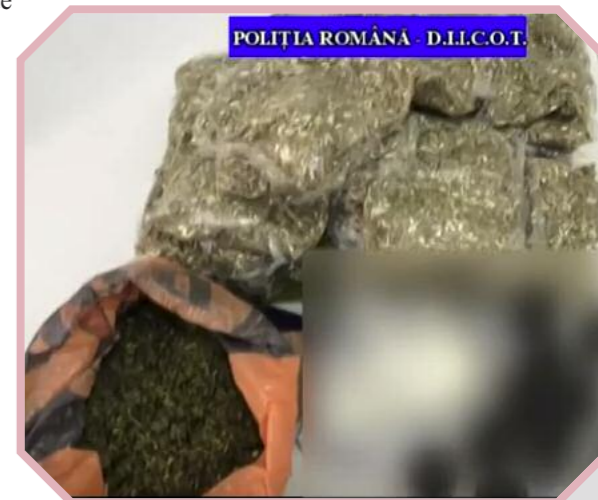
POLITIA ROMANA - D.I.I.C.O.T.

Din cercetări a rezultat că persoanele implicate ar fi vândut stradal, în special în municipiile Hunedoara, Deva și Orăștie, etnobotanice - la prețuri de