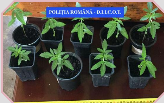
POLITIA ROMANA - D.I.I.C.O.T.

timp ce vindeau droguri de risc și de mare risc.