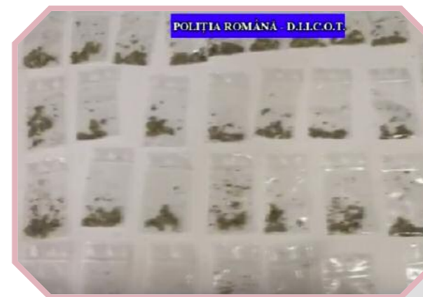
POLITIA ROMANA - D.I.I.C.O.T.

Ofițerii și agenții de la structura de combatere a criminalității organizate din Bistrița-Năsăud, cu suportul de specialitate al Direcției Operațiuni Speciale, sub coordonarea procurorilor