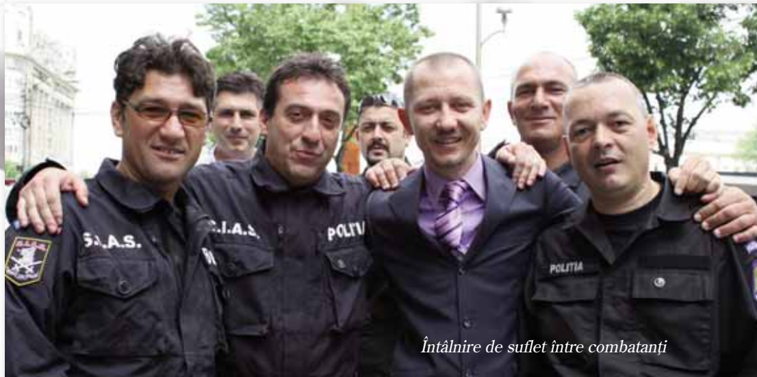
Întâlnire de suflet între combatanți

continuă perfecționare și de antrenament, la ceremonia împlinirii a 15 ani