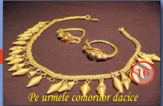
Pe urmele comorilor dacice