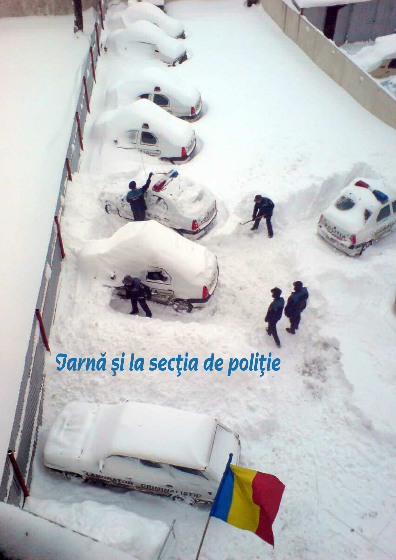
Țarnă și la secția de poliție