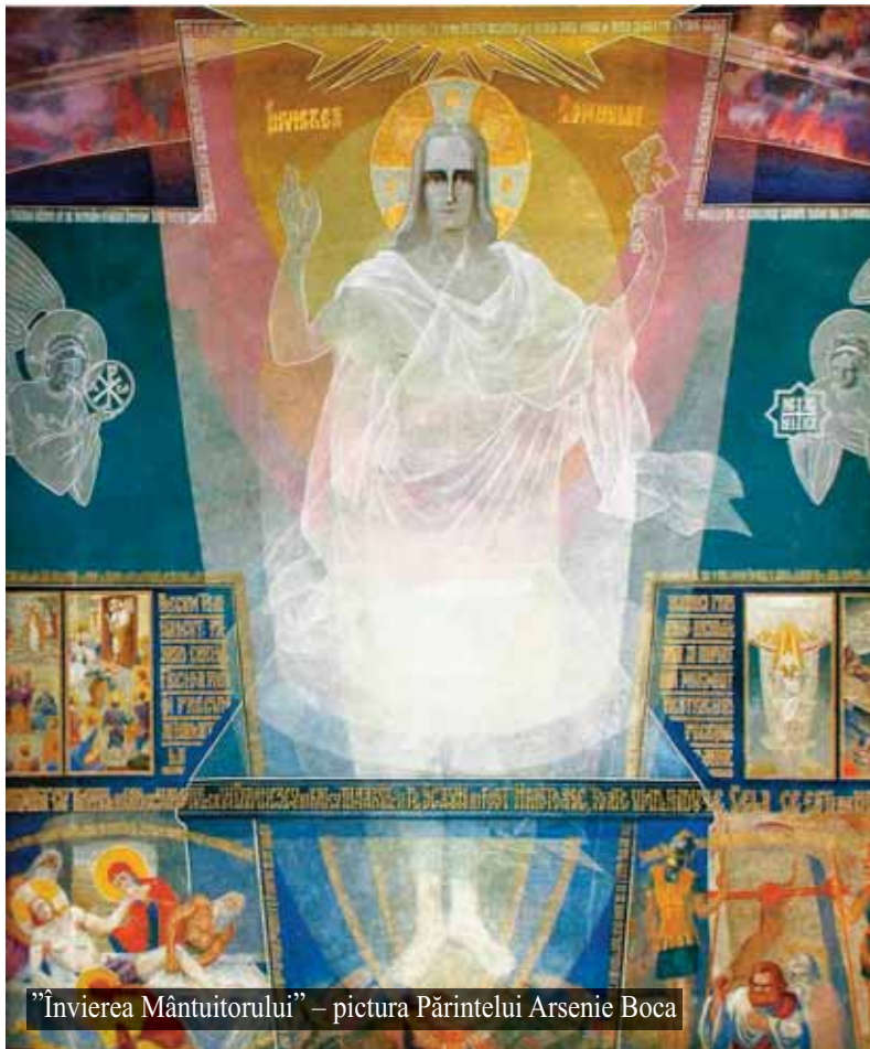
„Învierea Mântuitorului” – pictura Părintelui Arsenie Boca

„Veniți de luați Lumină, din Lumina lui Hristos, care luminează tuturor, prin Sfinți, ca să nu vă cuprindă întunericul!”