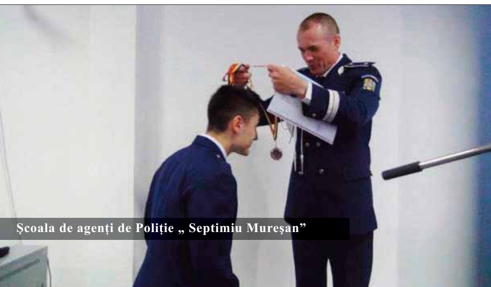
Școala de agenți de Poliție „Septimiu Mureșan”

Cursanții anului I și II care au participat la ”Olimpiada Competențelor specializate” și ”Olimpiada Comunicare profesională” au fost, la rândul lor, recompensați. Activitatea s-a încheiat cu vizionarea, în avanspremieră, a filmului de prezentare a unității de învățământ, denumit generic ”Pregătire europeană. Polițiști europeni”, realizat de către colegii de la Centrul Multimedia al Ministerului Afacerilor Interne.