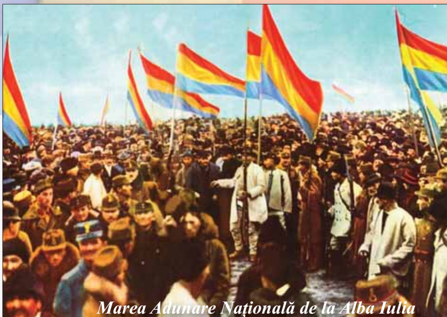
Marea Adunare Națională de la Alba Iulia

Adunarea națională dorește: Congresul de pace să asigure dreptatea și libertatea atât pentru națiunile mari, cât și pentru cele mici și să elimine războiul ca mijloc pentru reglementare a raporturilor internaționale. Ea salută pe frații lor din Bucovina, scăpați din jugul monarhiei austro-ungare, pe națiunile eliberate - cehoslovacă, austro-germană, iugoslavă, polonă și ruteană -, se închină cu smerenie înaintea acelor bravi români care și-au vărsat sângele în acest război pentru libertatea și unitatea națiunii române și exprimă mulțumirea și admirația sa tuturor puterilor aliate care, prin luptele purtate împotriva dușmanului, au scăpat civilizația din ghearele barbariei. La ceasurile 12 din ziua de 1 Decembrie, prin votarea unanimă a Re-