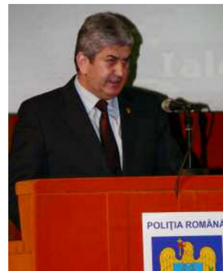
Gabriel Oprea – vice prim-ministru al Guvernului României

Principalele evenimente din anul 2012: Alegerile pentru autoritățile administrației publice locale. Finala “Europa League”; Referendumul pentru demiterea Președintelui României; Alegerile pentru Camera Deputaților și Senat; Prevenirea și combaterea efectelor fenomenelor meteorologice periculoase; Misiunile au fost îndeplinite cu