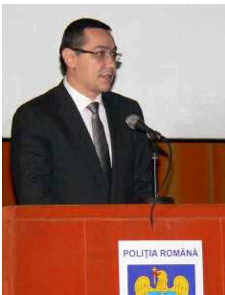
Victor Ponta - prim-ministru al Guvernului României

„Constituie o plăcere și o mândrie să trăiești într-o țară, România, în care Poliția este responsabilă și eficientă”.