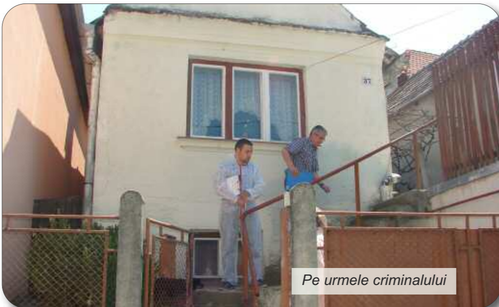
Pe urmele criminalului

Și la Sighișoara timpul medieval a fost spulberat. Oamenii din acest oraș al inimii Transilvaniei au trăit neliniștit cumplit, așteptând ca polițiștii să rezolve un caz extrem, un dublu asasinat.