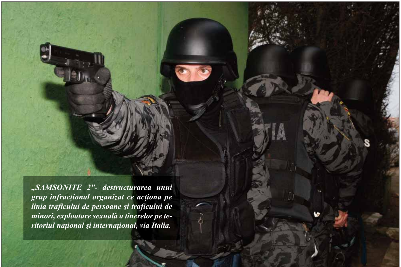
„SAMSONITE 2”- destructurarea unui grup infracțional organizat ce acționa pe linia traficului de persoane și traficului de minori, exploatare sexuală a tinerelor pe teritoriul național și internațional, via Italia.

“PANDORA” - acțiune desfășurată, împreună cu autoritățile americane, Birourile FBI și Secret Service din cadrul Ambasadei SUA la București. Au fost identificate șapte grupuri infracționale organizate, formate din aproximativ 100 membri, care săvârșeau, pe plan mondial, infracțiuni cu instrumente de plată electronice.