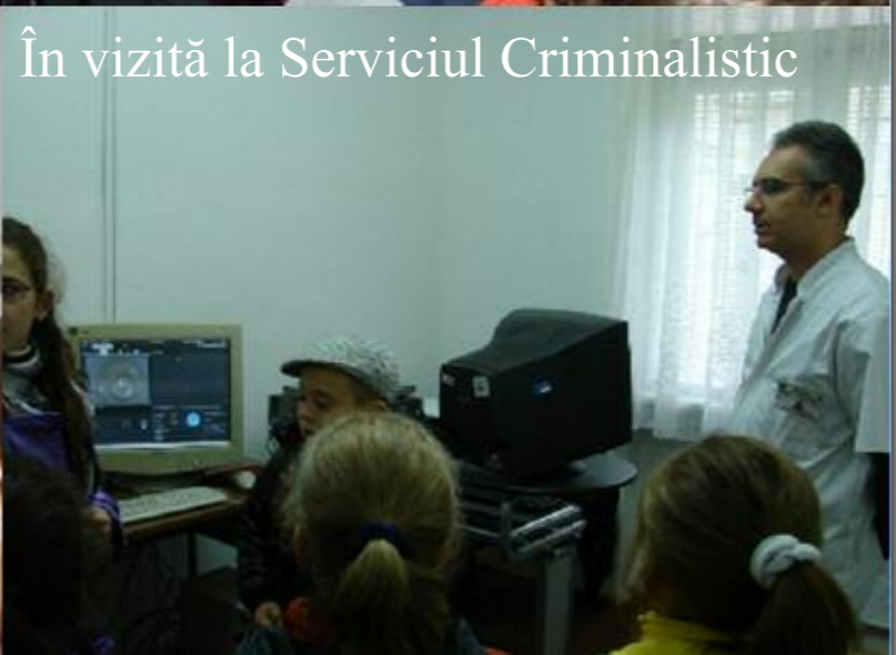
În vizită la Serviciul Criminalistic